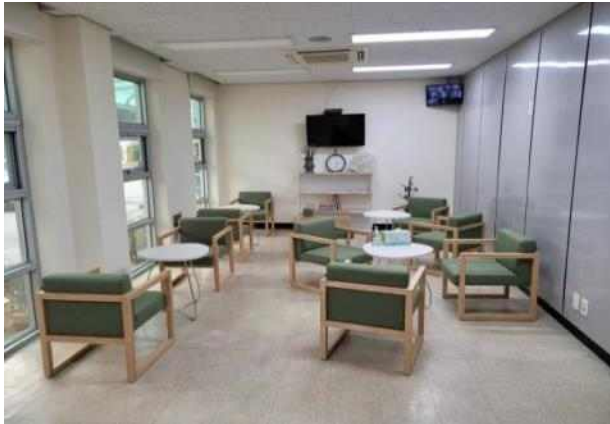
1층 휴게실 II