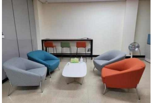
1층 휴게실 I