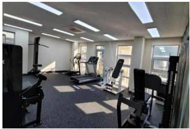
2층 체력단련실 I