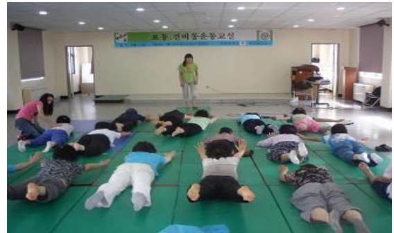
요통 자가 운동