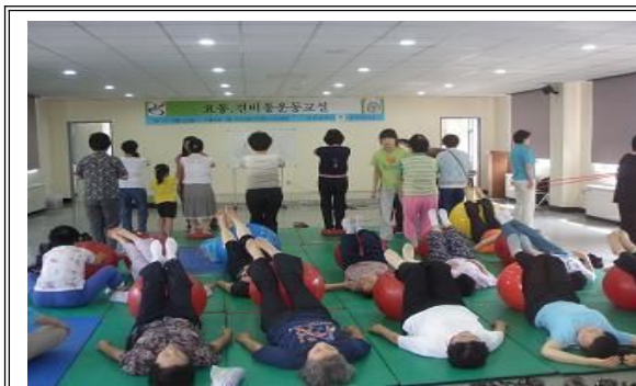
스위스볼을 이용한 요통운동