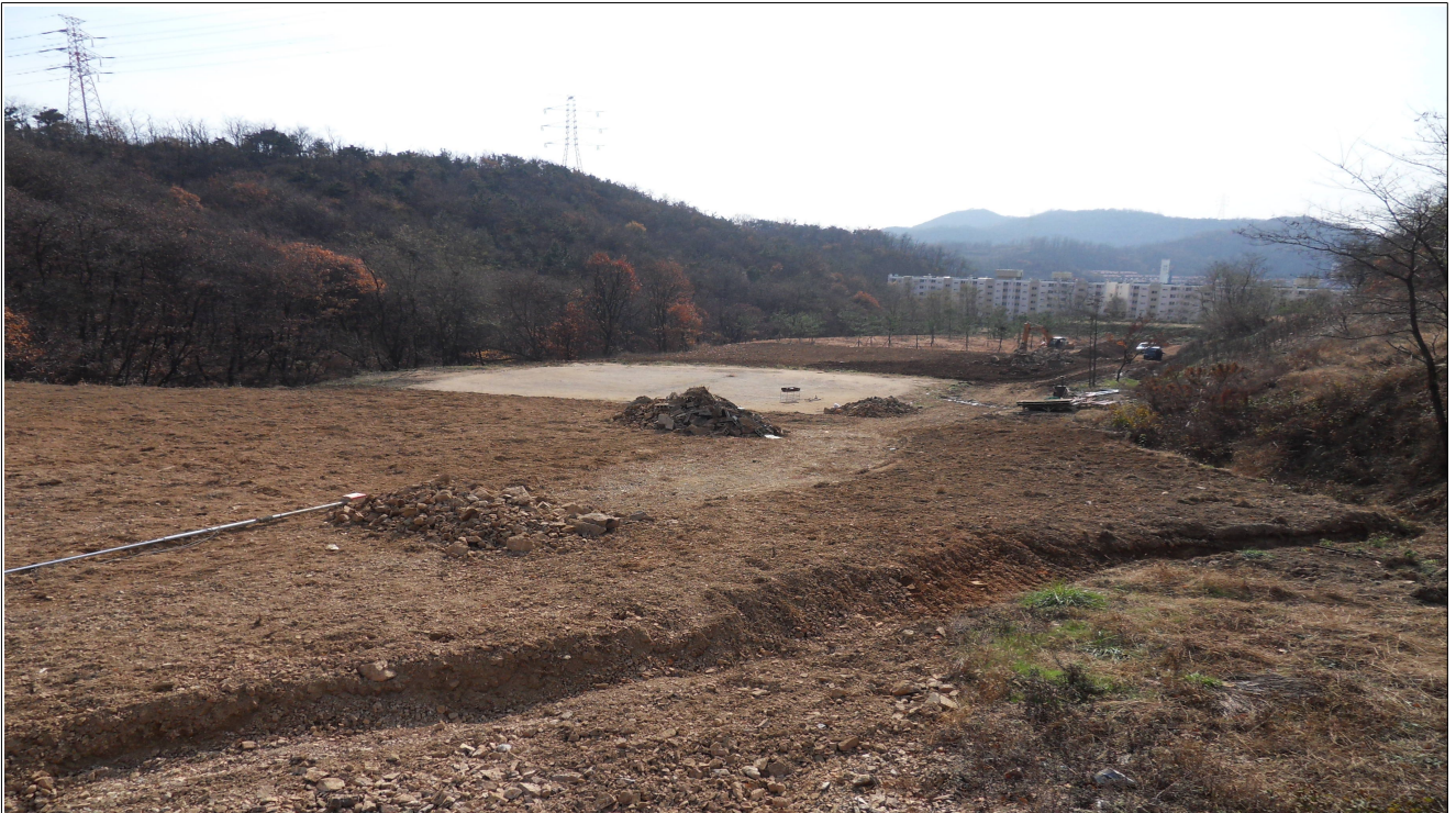
가정동 산21-1번지 나무은행(가식장) 전경