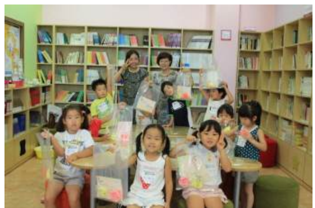
<천연비누로 만나는 선사시대>