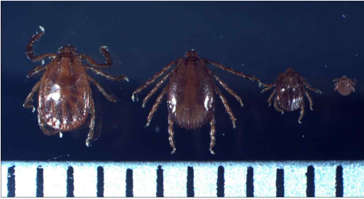
<작은소참진드기 (좌로부터 임컷, 수컷, 약충, 유충) (단위 :mm)>