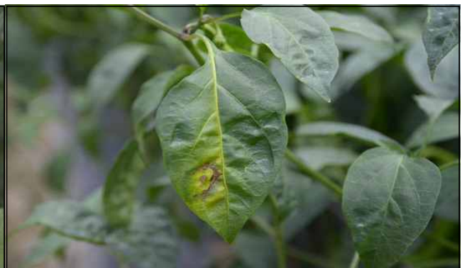
【고추의 잎 괴사반점(국화 하우스 주변)】