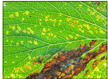
【후기 잎 증상】