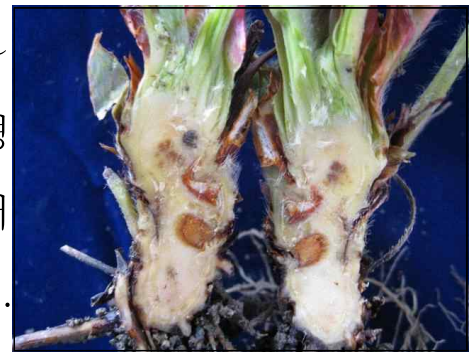
【작은뿌리파리와 탄저병 복합 증상】

○ 작은뿌리파리는 그 유충이 딸기의 뿌리 및 관부(뿌리와 잎이 발생하는 생장점 부근)를 가해하여 1~2소엽이 작아지거나 짝잎이 되는 기형이 되고 뿌리와 관부의 바깥부분부터 갈변하여 심할 경우 식물체가 고사됨. 딸기의 피해 증상은 탄저병이나 시들음병과 유사하여 구분하기 힘들고, 이들과 동시에 발생하여 진단이 어렵기 때문에 반드시 뿌리와 관부를 확대경으로 검경하여 유충이 발견되는지 확인