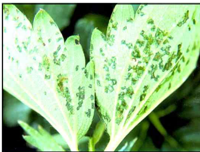
【잎 뒷면 수침상 증상】