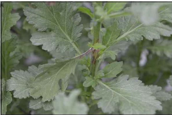
【줄기의 괴사 증상】