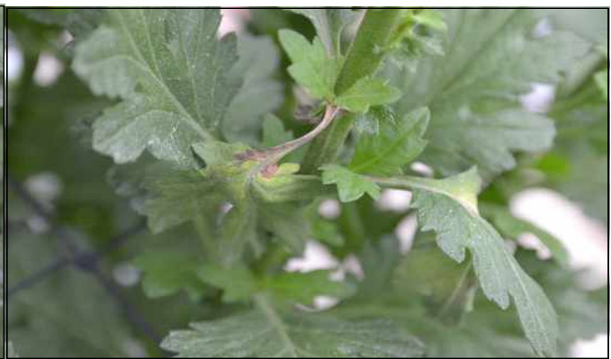
【국화 잎자루의 괴사 증상】