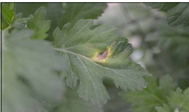
【잎의 괴사반점 증상】