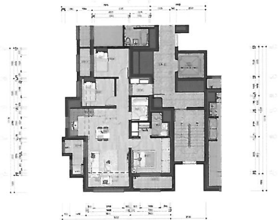
59B 단위세대 평면도(확장형)