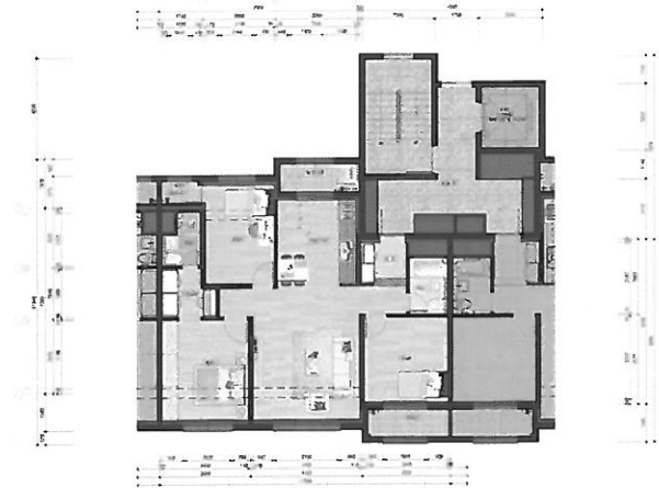
84A 단위세대 평면도(확장형)