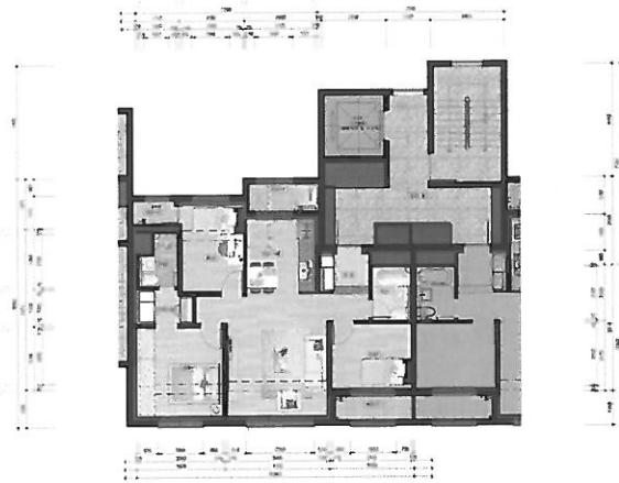
59B 단위세대 평면도(확장형)