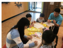
선사 시대 이야기 가방

주제 전시실 관람을 통해 선사 시대와 선사 시대 유물을 이해하고, 유물을 장식으로 한 가방 만들기 일시 2017년 5월 13일(토) 14:00~16:00 장소 검단선사박물관 아동도서실(2층), 전시실 대상 6세~초등학생 자녀를 동반한 가족 신청 검단선사박물관 홈페이지 선착순 접수 (4월 25일(화)부터) 문의 032-440-6797