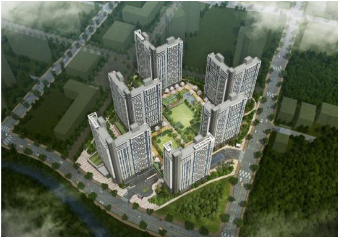
▲ B6 조감도(C2,C3조감도 생략)