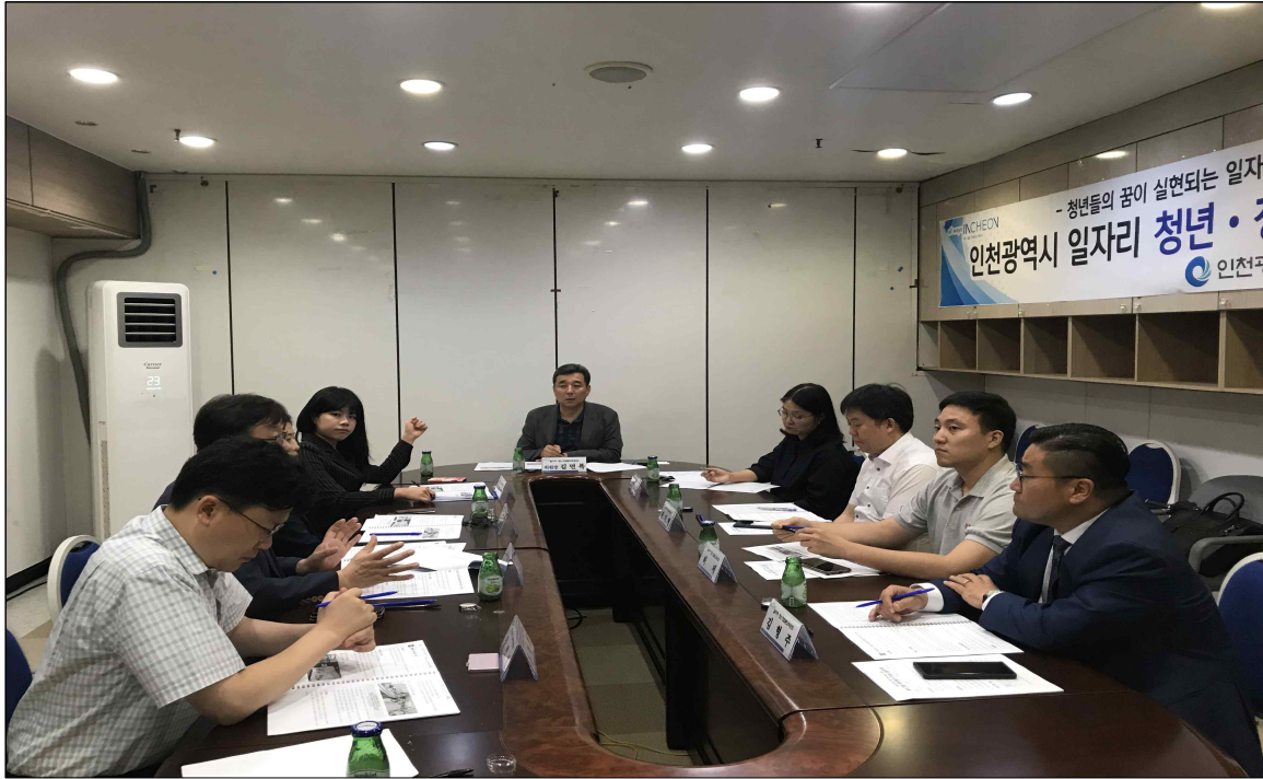
▲ 회의 진행