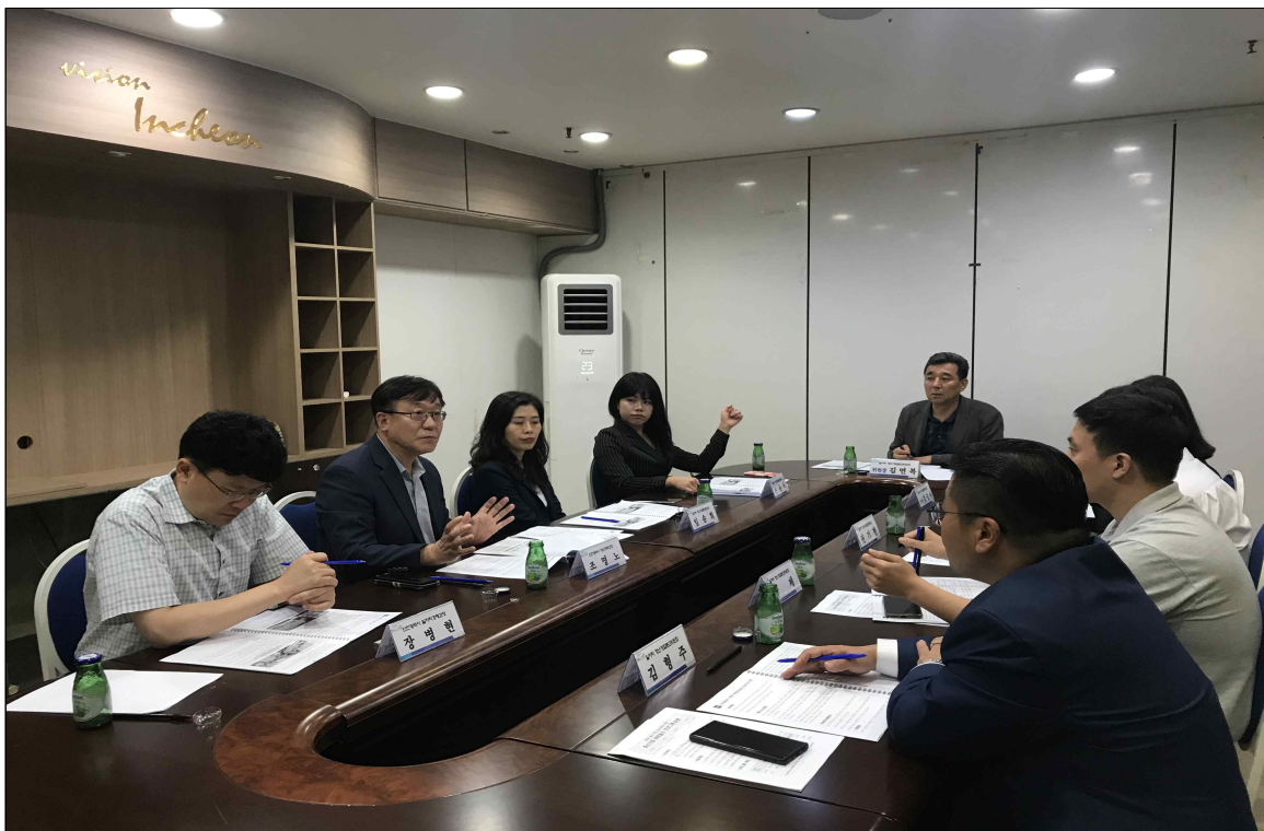
▲ 회의 진행