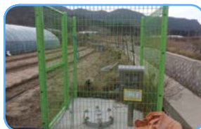
취수원 (지하수, 계곡수 등)