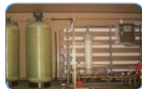
정수시설 (역삼투압, 이온수지 등)