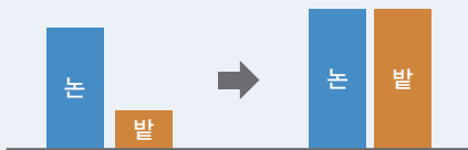
개편 전·후 직불단가 비교(농업진흥지역)

다만, ① 농업진흥지역 내의 논·밭, ② 농업진흥지역 밖의 논, ③ 농업진흥지역 밖의 밭 등 3단계로 구분하여 단가 차등