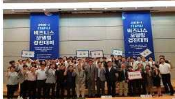
< 경진대회 시상 >