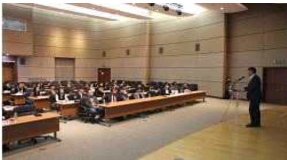
< 대학별 팀프로젝트 킥오프 개최 >