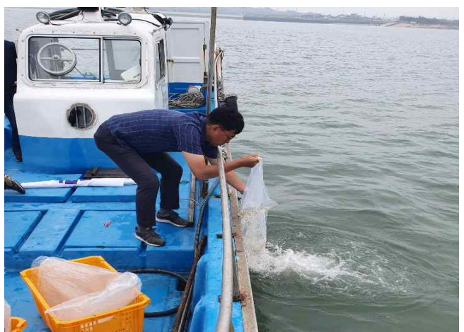
4. 영종해역 갯오징어 방류(2차)