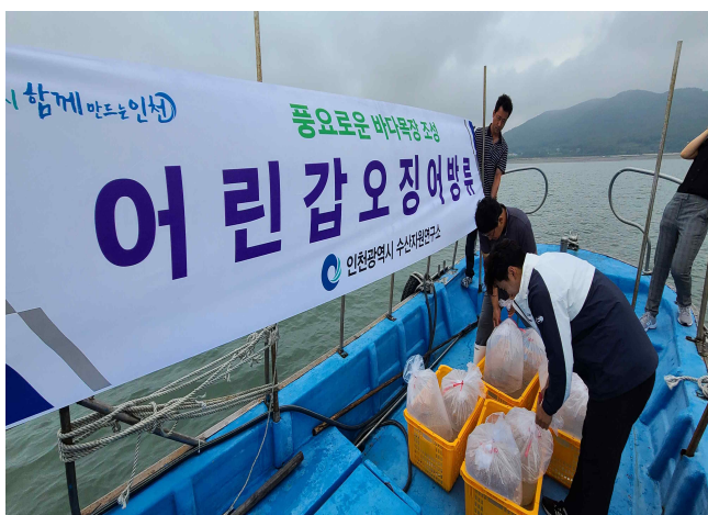
3. 영종해역 갯오징어 방류(2차)