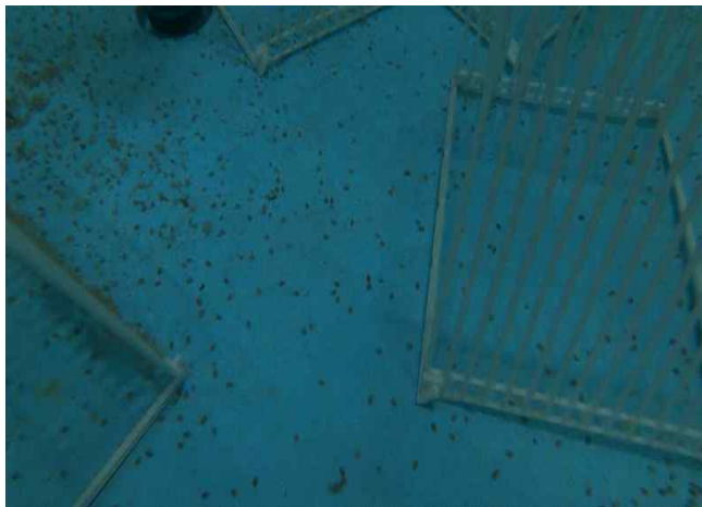
1. 부화한 갯오징어