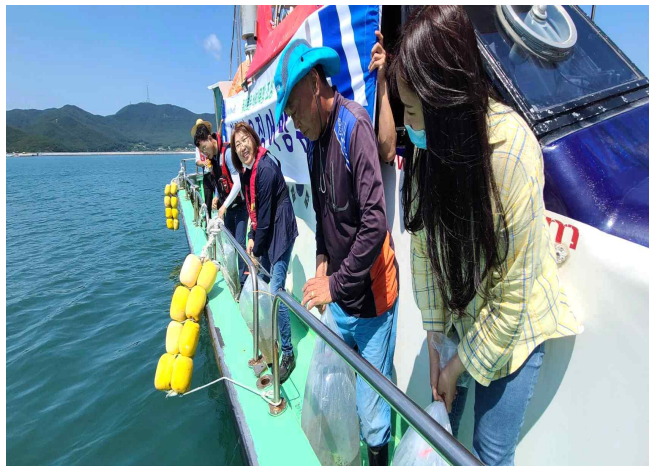
2. 덕적해역 갯오징어 방류(1차)