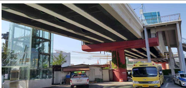
만석고가교 승강기 전경