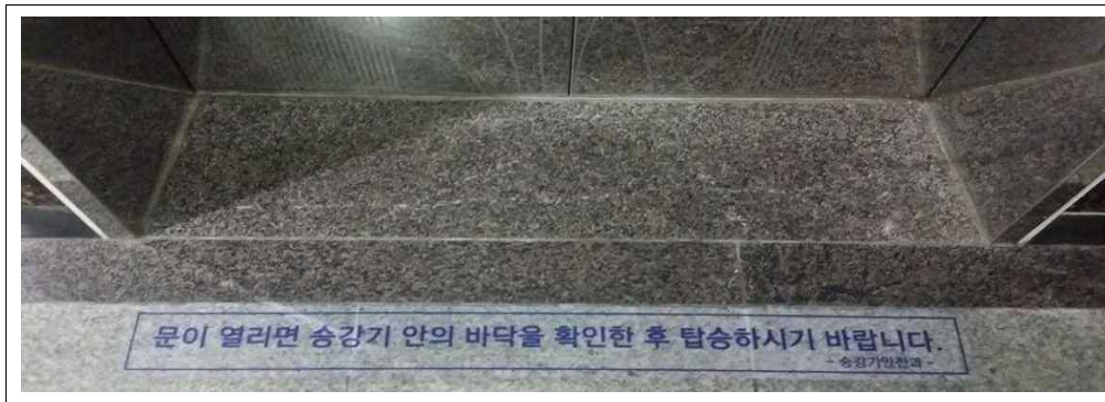
【그림 1】 엘리베이터 안전이용 안내 표지 부착 예시

이와 관련하여 종합건설본부 ◇◇부에서 관리하고 있는 계양대교 등 5개소에 설치된 교량 승강기 16대에 대하여 안전관리 실태를 현장 점검한 결과, [표 1]과 같이 승강기 안전관리자를 선임하였으나 선임된 안전관리자가 관계법규에서 정한 안전관리자 직무를 숙지하지 못하여 ‘승강기 운행 및 관리규정’을 작성하지 않았고,