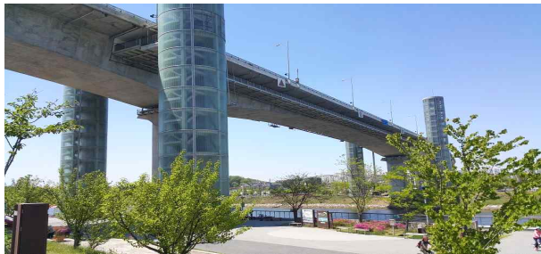
계양대교(굴현대위) 승강기 전경