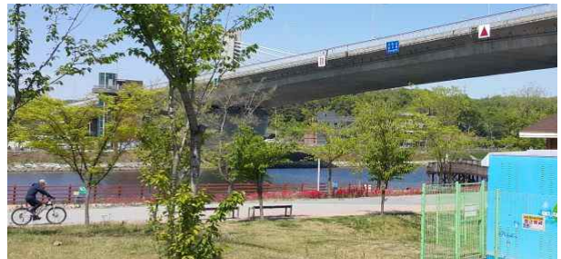
시천교 승강기 전경