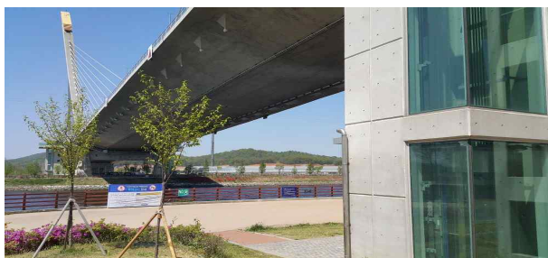
백석대교 승강기 전경