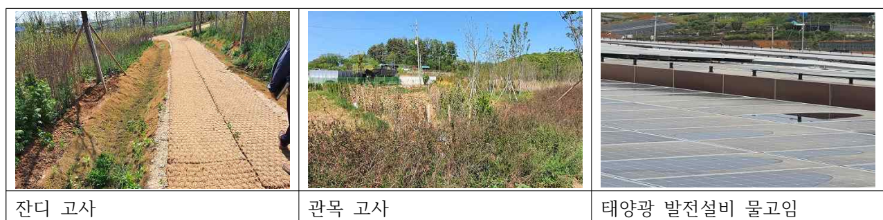
【표 2】 잔디 및 태양광 발전설비

또한 채소동 및 과일동 옥상에 설치된 태양광발전설비는 태양광발전설비 설치 가이드북(한국전기공사협회, 2017년 1월 발행)에 따르면 태양광 발전설비는 온도, 강우량, 일사량 등의 조건을 고려하여 30도 내외의 경사각으로 설치하는 것이 가장 효율적이라고 정하고 있다. 이에따라 남촌농산물도매시장의 태양광발전설비를 확인한 결과 옥상면과 평행하게 시공되어 우기 시 물이 고이고 먼지가 쌓여 정상 발전량인 80%에 못미치는 약 50%정도의 태양광에너지를 발전하고 있는 상태이다.