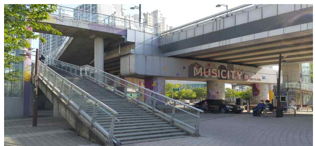
백운고가교 승강기 전경