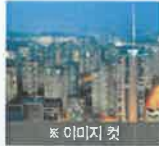
롯데 이미지 컷