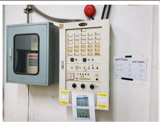
[그림2] 지하변전실 전실 설치 수신기