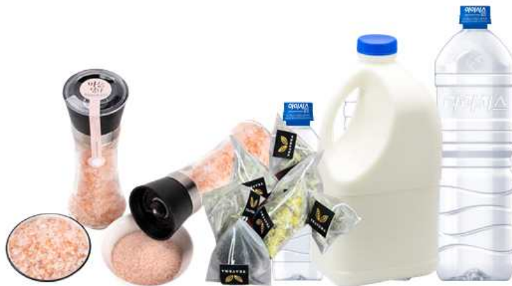
< 식품에 사용되는 플라스틱 제품들 >