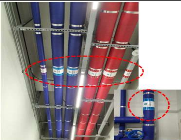
사진3 (전체) 배관 흐름방향 및 인식표 부착 양호