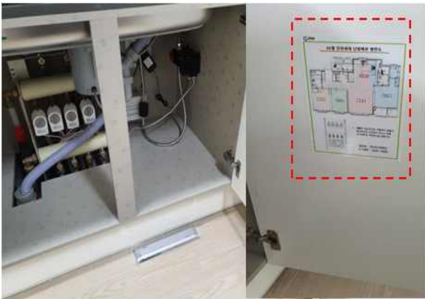
사진1 (세대) 싱크대하부 온수분배기(난방구획도) 부착 양호