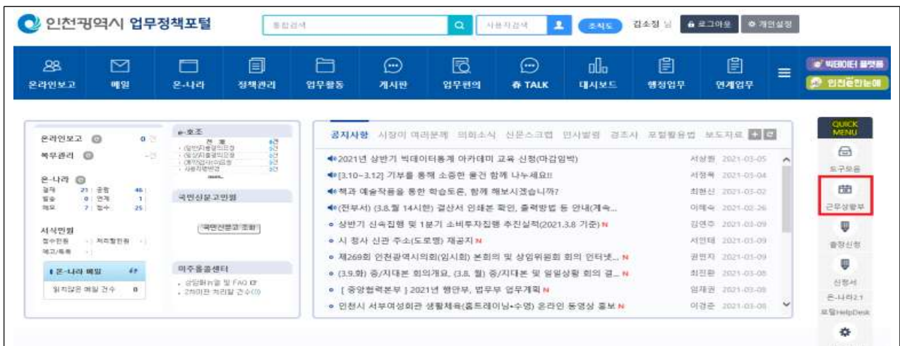
【그림1】 인천광역시 업무정책포털 화면

따라서 공무원 스스로 본인의 휴가 상황을 수시로 관리하여야 함은 물론, 각 부서(기관)장은 소속 공무원이 연가일수 범위 내에서 연가를 사용할 수 있도록 복무 관리에 철저를 기하여 부여된 연가 일수를 초과하여 연가를 사용·신청한 경우 이를 승인해서는 안된다.