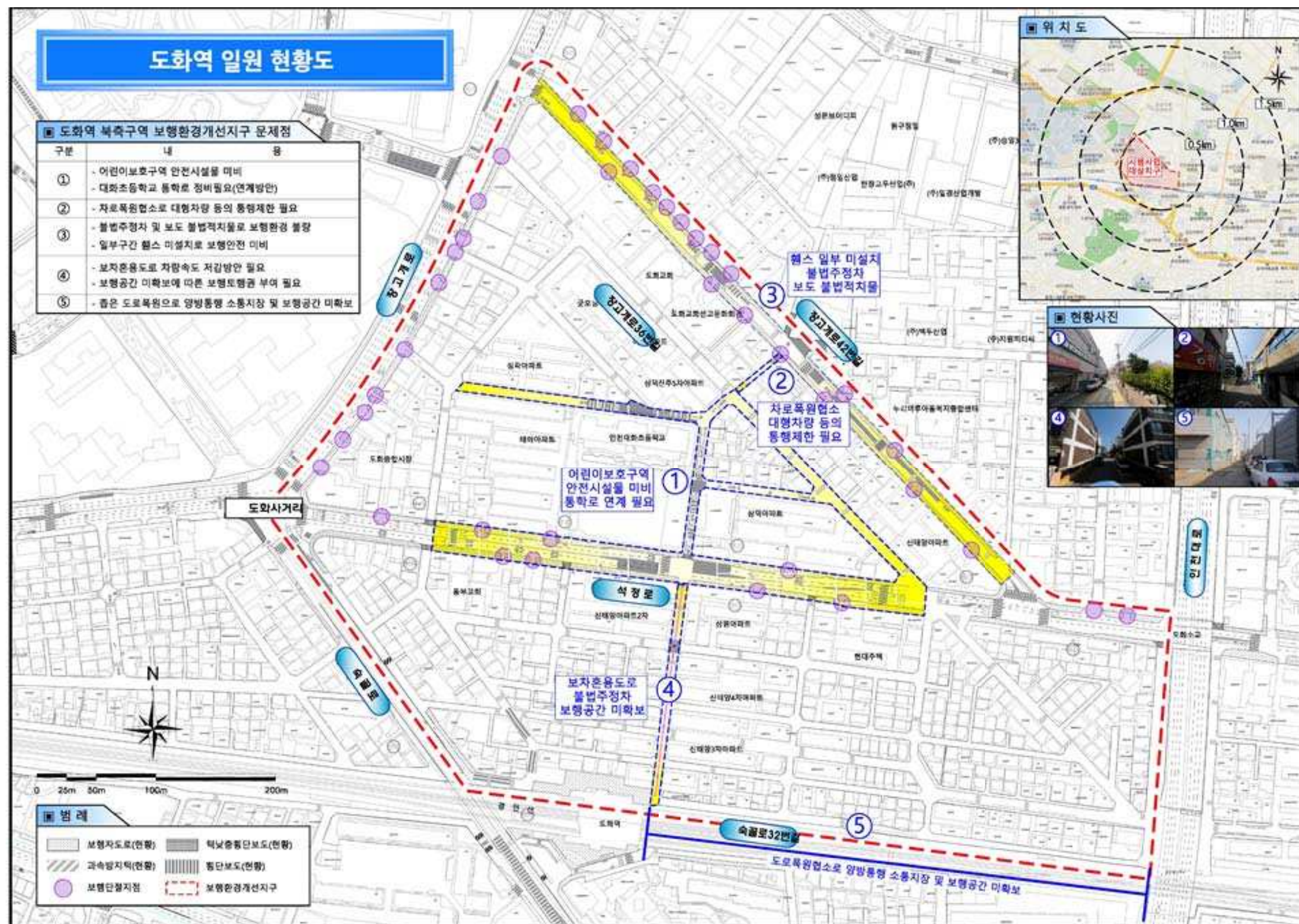
[ 도화역 일원 현황도 ]