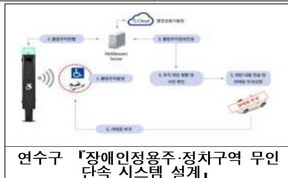
연수구 「장애인정용주·정차구역 무인단속 시스템 설계」