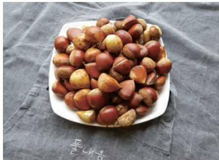
주운 풋밤 한 접시