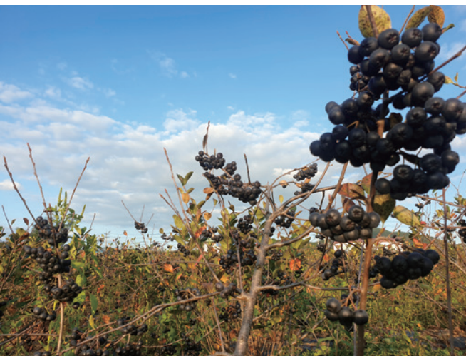
탐스러운 아로니아 열매

농사경력은 오래되지 않았지만, 농사에 대한 열정과 마음가짐은 20년 경력의 아버지 못지않다. 2019년도에 강소농에 가입하고 교육을 들으면서 농장운영에 대한 방향을 생각해보게 됐고, 2021년도에 다시 강소농 교육내용을 농장에 적용해가면서 운영을 체계화하고 있다. 기존 직거래와 농협에만 판매하던 방식에서, 로컬푸드 판매장 납품과 온라인 판로를 개척하여 택배배송도 시작했다. 농업기술센터의 우수농산물 브랜드화 시범사업에 선정되어 브랜드 상표출원과 포장재 제작 등 농장을 브랜드화 시켜 온 가족이 정성들여 키운 농산물의 가치를 높이도록 노력하고 있다.