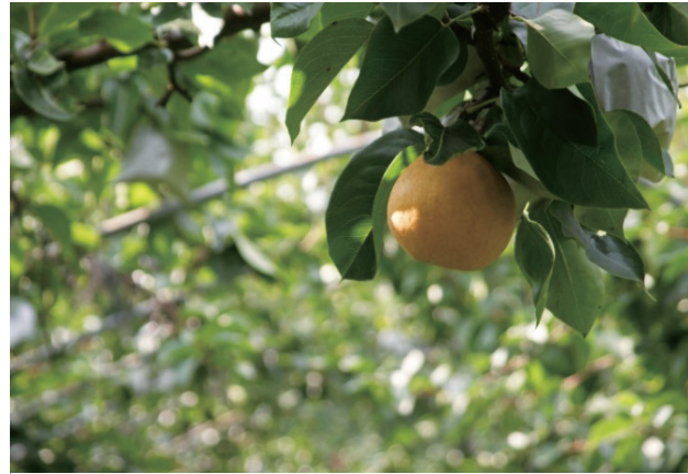
탐스럽게 익은 남동배

2020년에는 수산동에 창고를 신축하여 손님들이 깔끔한 공간에 더 편하게 방문할 수 있도록 접근성을 높였고, 농업기술센터를 통해 진행한 경신농장 상표출원, 브랜드 디자인 개발, 포장재 개선 등을 통해 브랜드 가치를 향상시켰다.