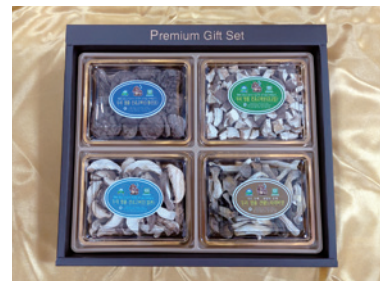
두리생생 건표고버섯 선물세트