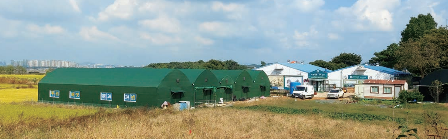
두리버섯농원 오리울농촌교육농장 전경