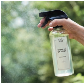
야외활동을 위한 농부스프레이

“산림의 공익적인 기능을 살려 활용하고, 우리 지역과 밤나무숲의 자원을 상품에 잘 녹여내고 싶어요. 풀내음 밤나무 숲에서는 팜파티, 음악회 등도 열고 있는데 숲을 문화와 연결하는 복합문화공간을 조성하고 싶습니다.”