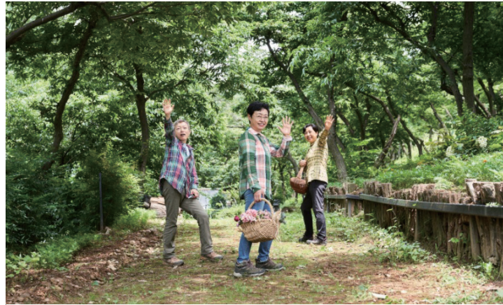
밤나무숲에서 세 자매