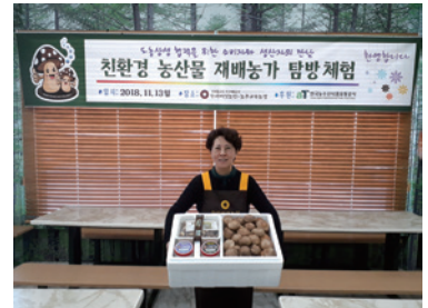
두리생생 표고버섯 종합선물세트

또한 코로나로 인한 사회적 거리두기로 인해 현장 체험이 어려운 현실을 감안해 가정에서 온 가족이 참여할 수 있는 ‘표고버섯 초밥만들기’ 요리활동 밀키트와 베란타텃밭 ‘두리생생 버섯 재배 키트’를 개발하여 큰 호응을 얻고 있다.