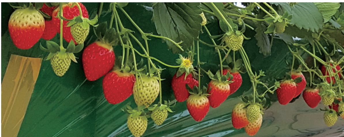
맛있게 익어가는 딸기