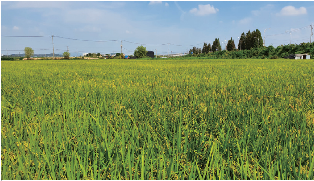
수확을 기다리는 벼들