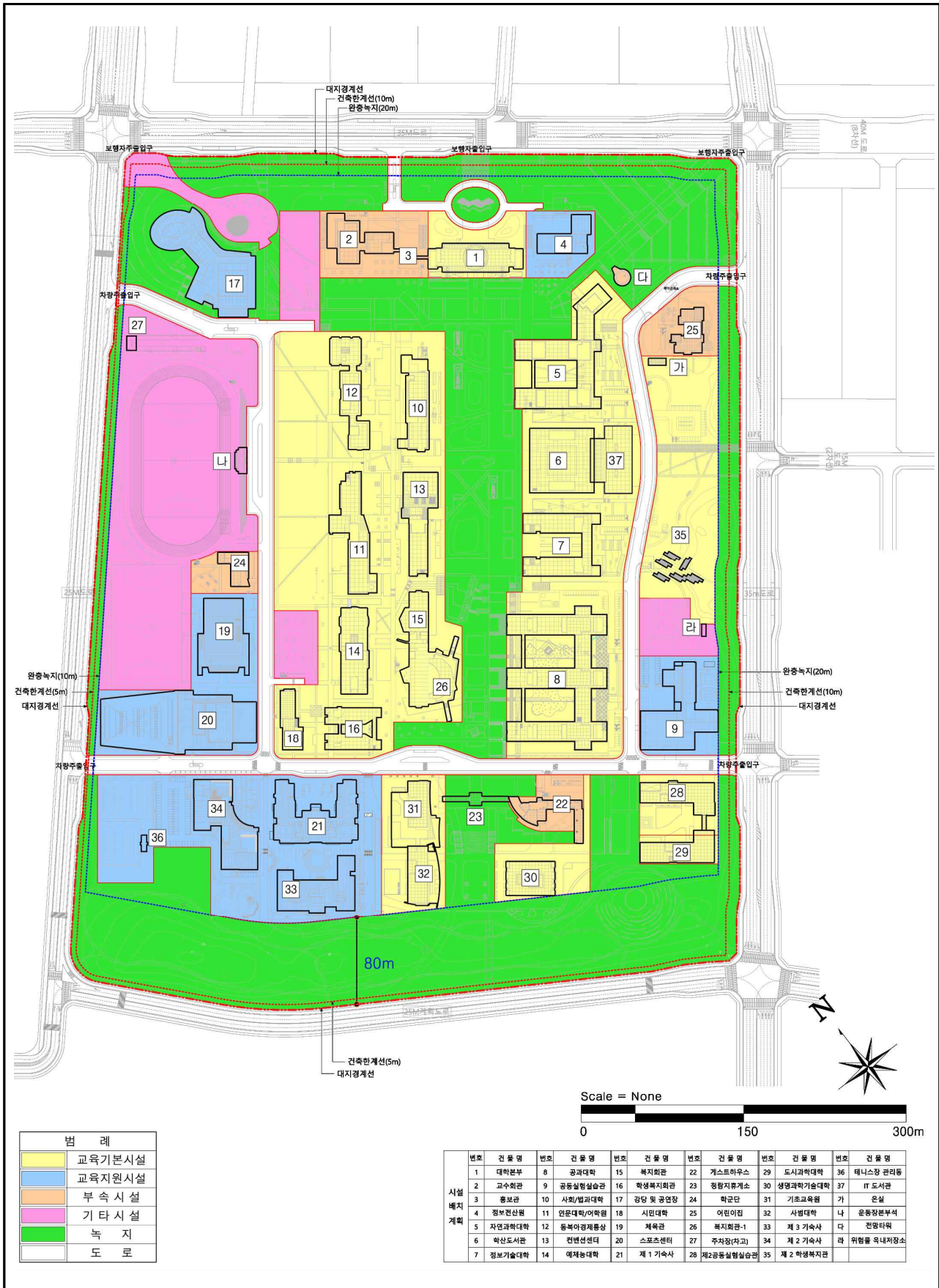
&lt; 학교시설(대학교) 세부시설 조성계획도 (변경) &gt;