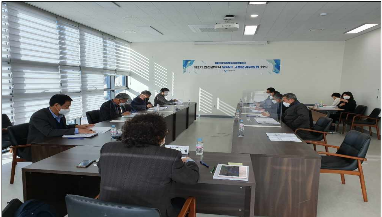
▲ 회의 진행