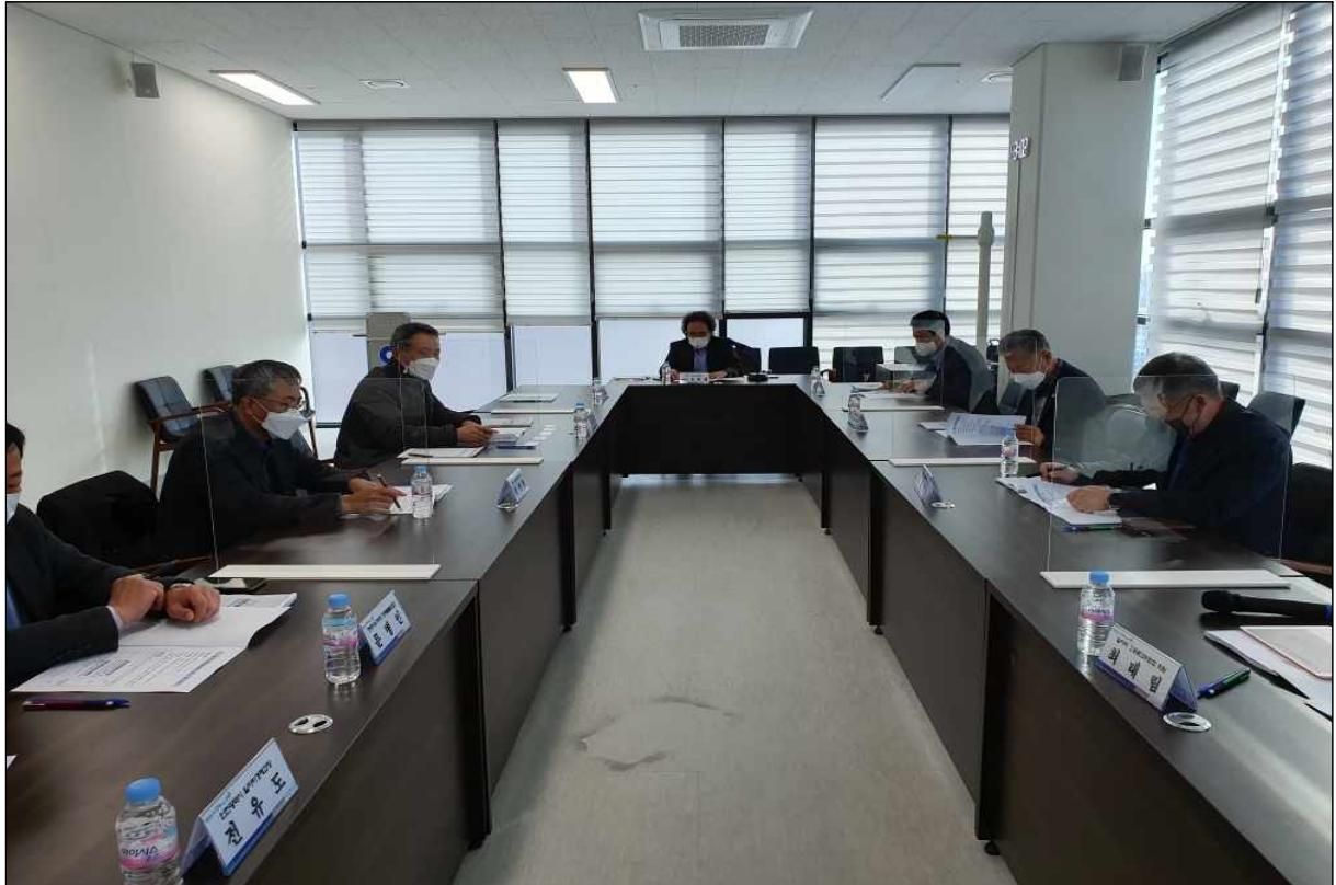
▲ 화상회의 화면 스크랩