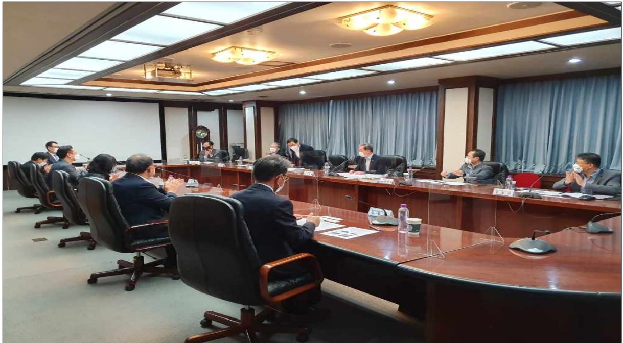
▲ 관사 선정 (측면)