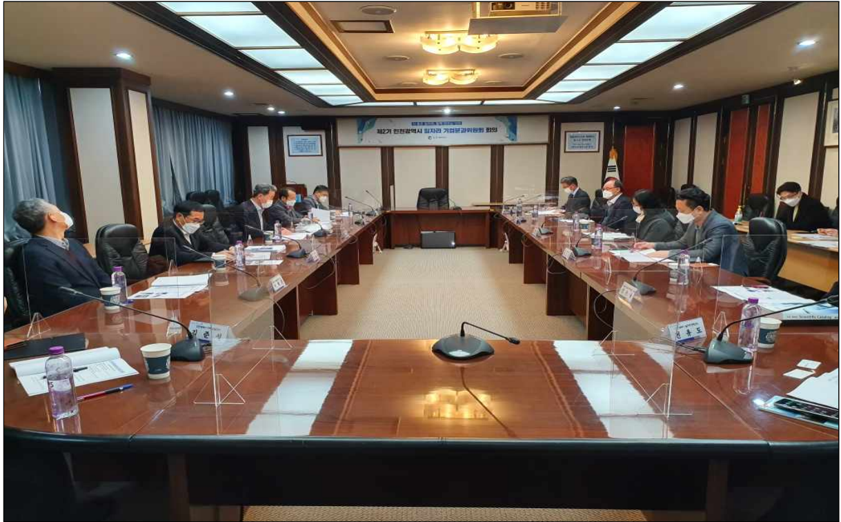
▲ 안건 논의 (전면)