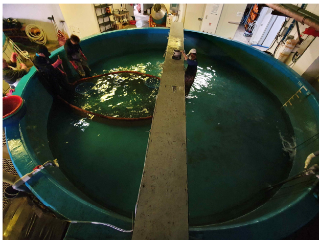
점농어 포획 작업