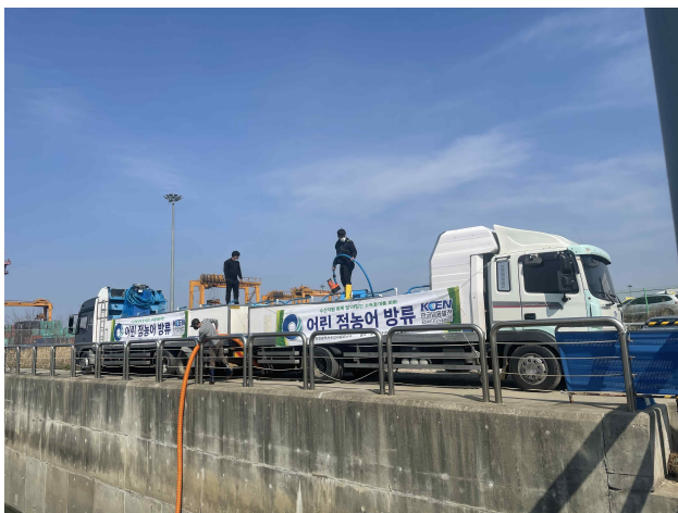
2차 방류(서구 경인항 관리부두)