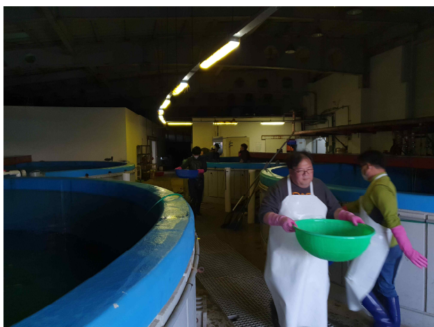
점농어 운반 작업