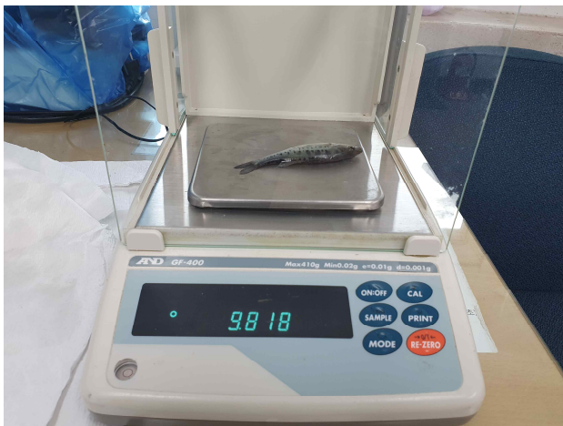
점농어 체중 측정