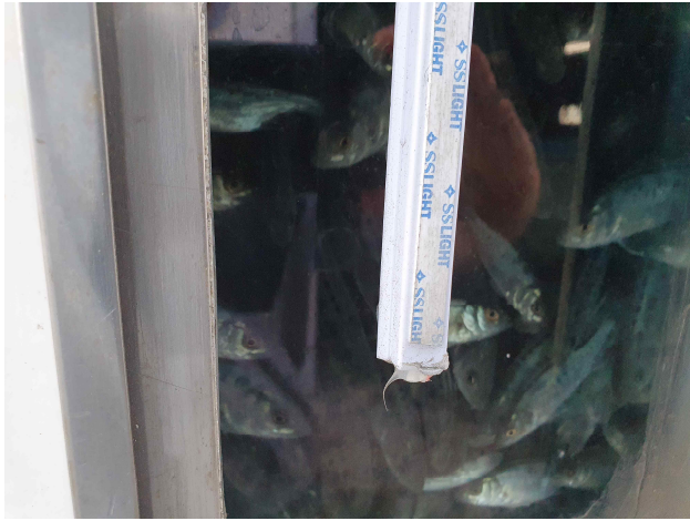
할어칸에 있는 어린 점농어