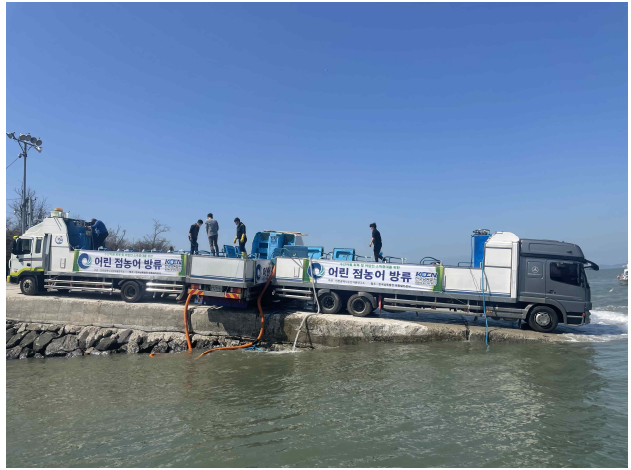
1차 방류(중구 영종도 삼목선착장)