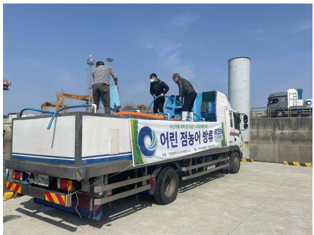
2차 방류(서구 경인항 관리부두)