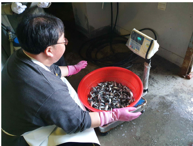
활어차 상차전 점농어 계량작업