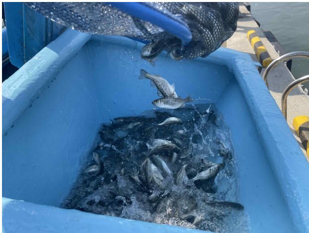
방류기를 이용한 점농어 방류(1)