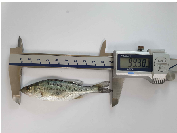
점농어 전장 측정