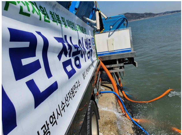
방류기를 이용한 점농어 방류(1)