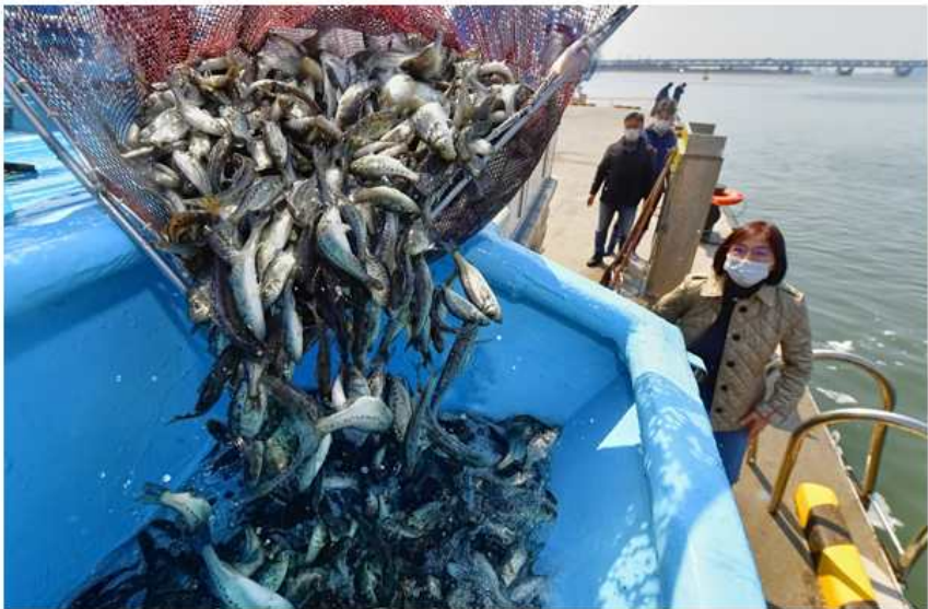
인천수산자원연구소와 한국남동발전 영흥발전본부가 주최한 '어린 점농어 방류 행사'가 6일 인천시 서구 세어도 선착장에서 열려 관계자들이 점농어를 해역으로 방류시키고 있다. 이번 행사로 영종도와 세어도 해역에 점농어 25만 마리가 방류됐다.