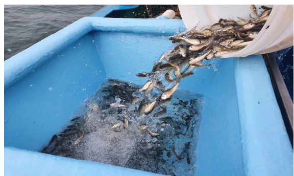
방류통을 이용한 참조기 방류 작업