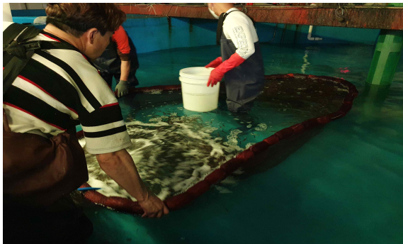
참조기 포획 작업