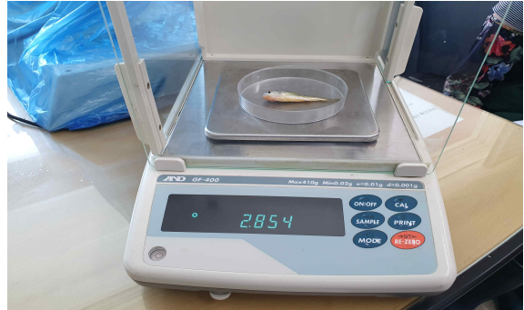
참조기 체중 측정