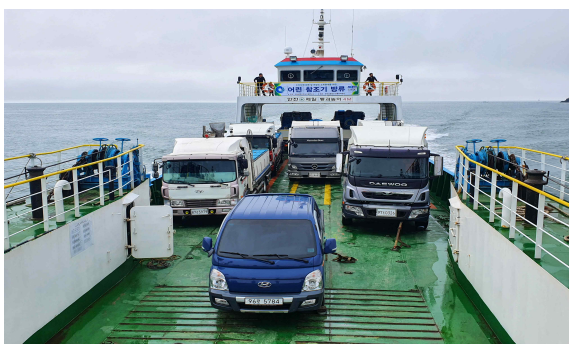
방류해역 도착 후 참조기 포획작업