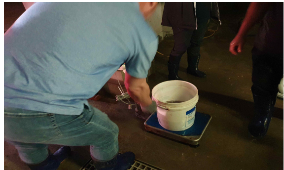
활어차 상차전 참조기 계량작업