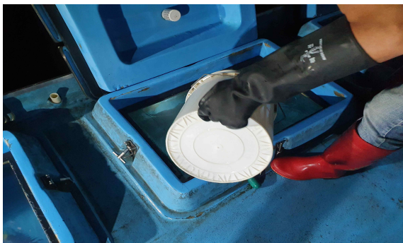
활어차에 참조기 입식