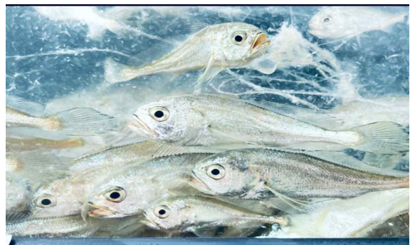
활어차 물칸에 있는 참조기