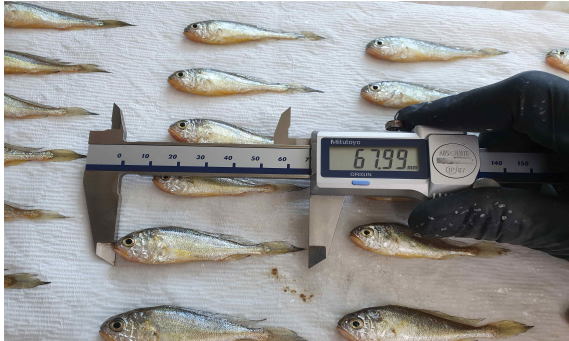
참조기 전장 측정