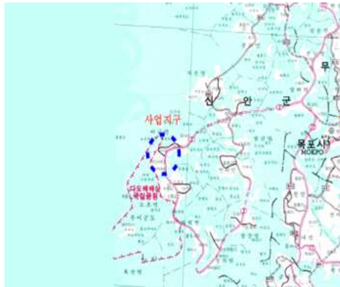
<광역 위치도 예시>