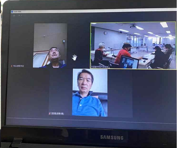
〈2022년 주민참여예산 복지건강분과 제2차 회의〉