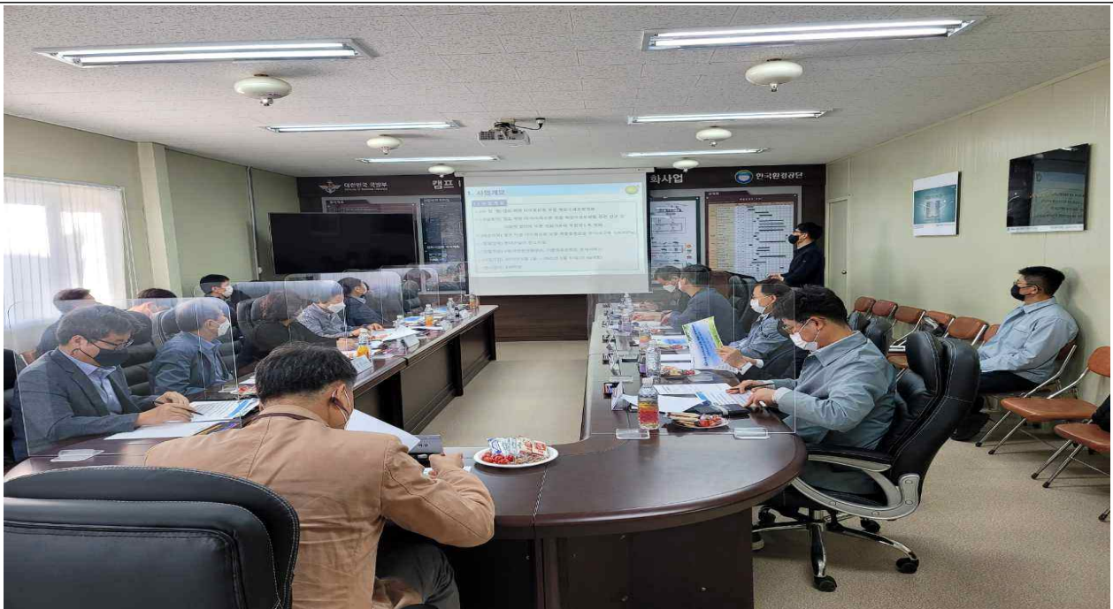
제17차 민관협의회 회의