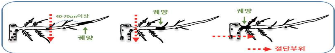
【과수화상병 의심 시료 채취 요령】