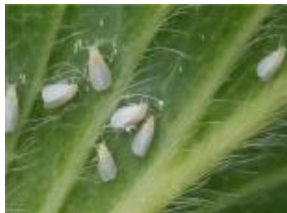
【온실가루이 성충과 알】