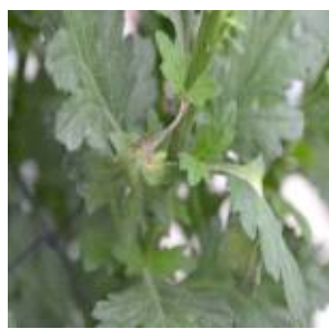
【잎자루의 괴사 증상】