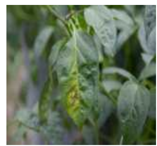
【국화 하우스 주변 고추 잎 괴사반점】