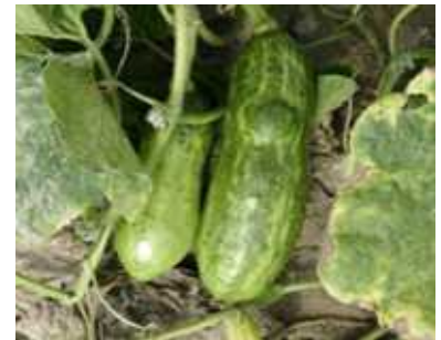
【호박 ZYMV 증상】

○ 호박, 오이 등 과채류에서 전년에 이어 발생이 증가할 것으로 예상되며, 진딧물이 병을 매개하는 한편 이병식물의 접촉에 의한 전염도 가능하므로 농작업 시 주의가 필요