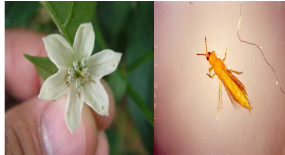
【병을 전염시키는 총채벌레】