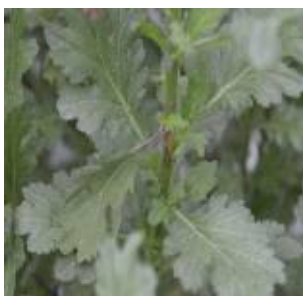
【줄기의 괴사 증상】