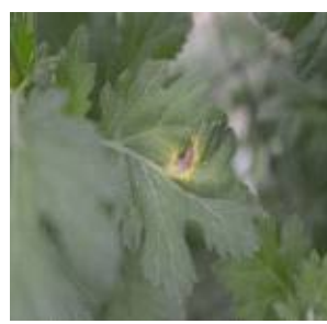
【잎의 괴사반점 증상】