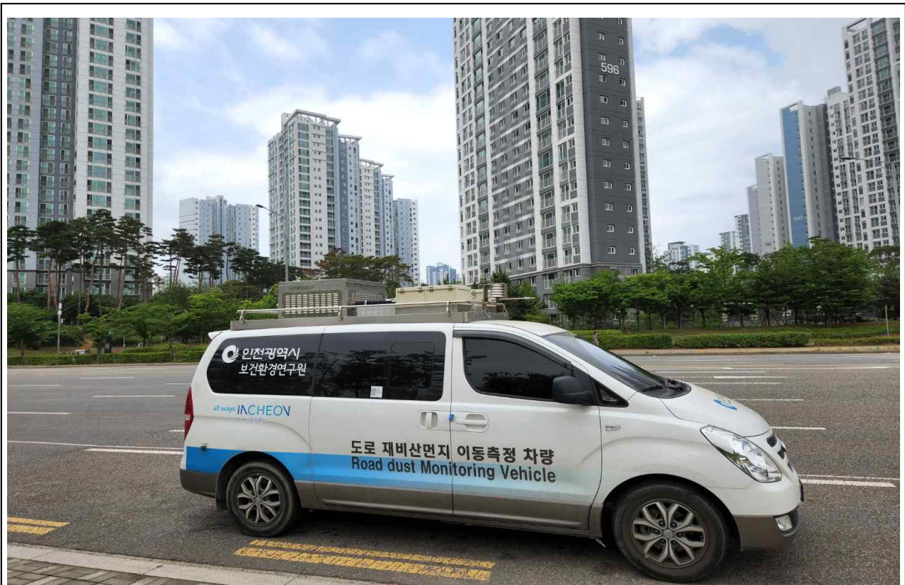
도로 재비산먼지 이동측정차량