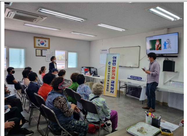
어업인 전문기술 교육