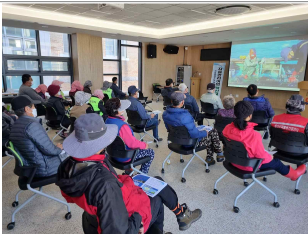
자율관리어업 확산 교육