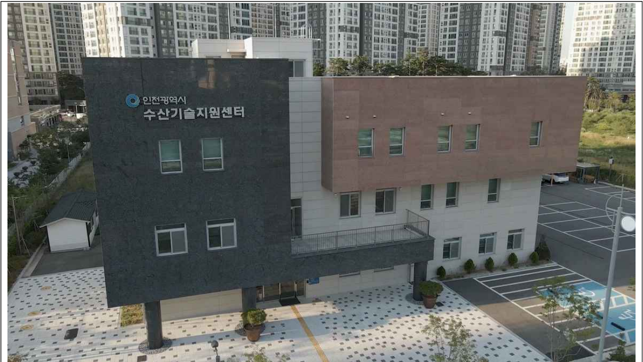
인천광역시 수산기술지원센터 전경