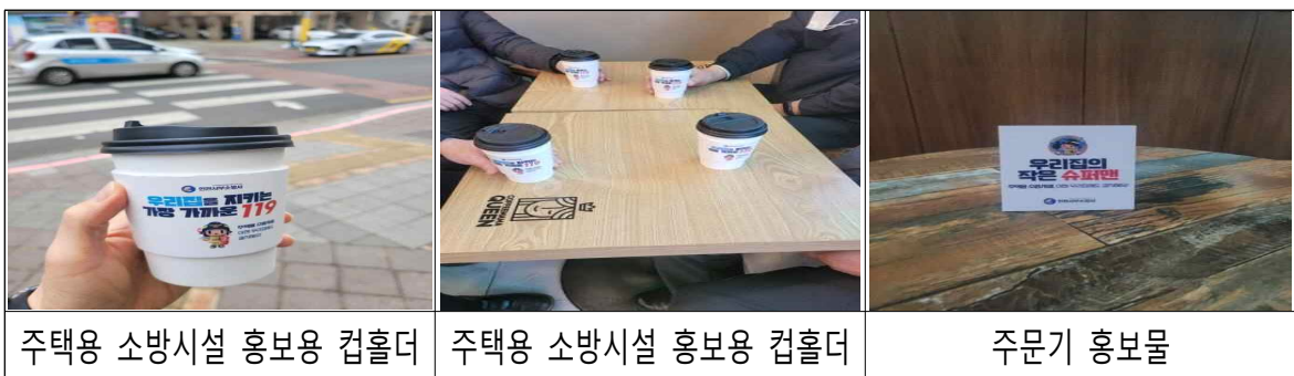
주택용 소방시설 홍보용 컵홀더