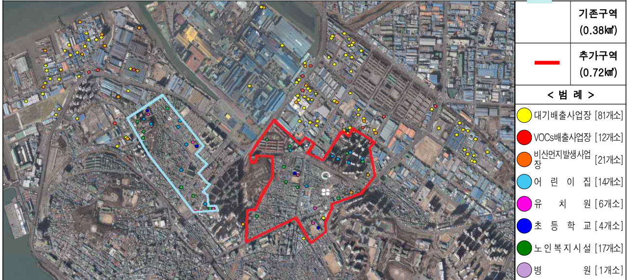
동구 화수·화평동 및 송현·송림동 일원(1.1km 2 )