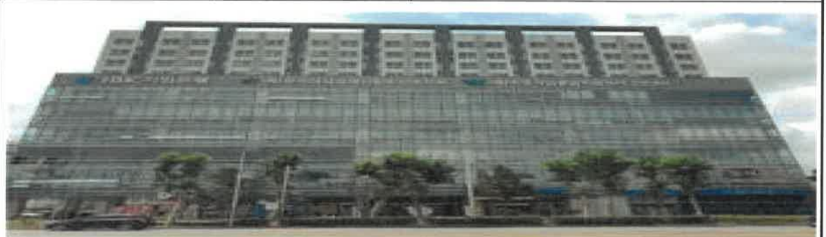
센터 전경 (외부)