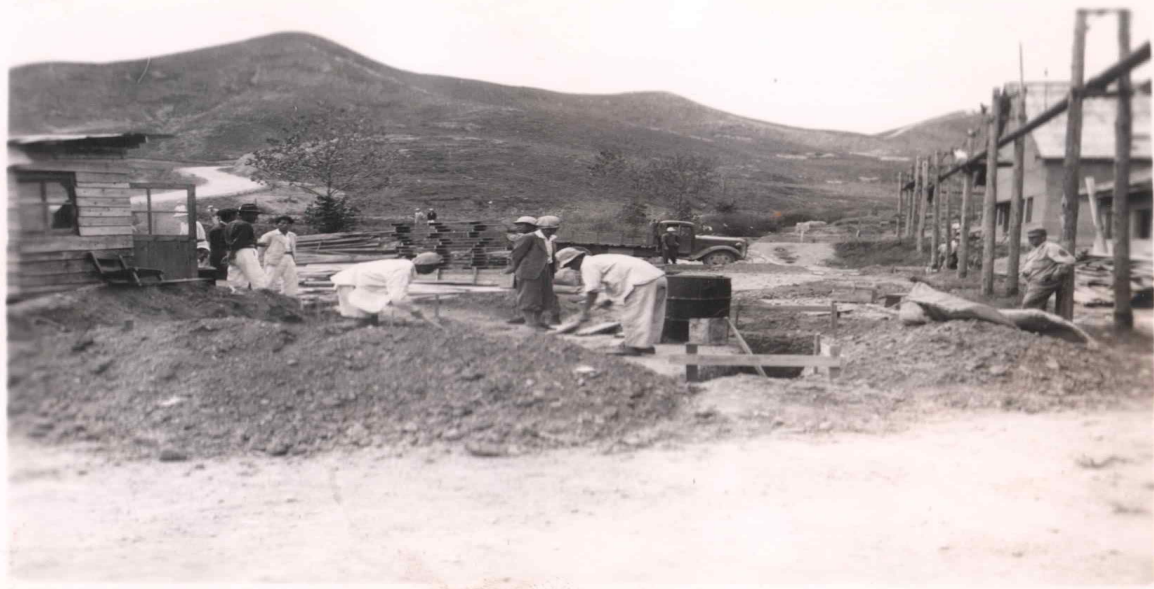
Construction of Troop Housing 52nd Signal by 340th Engr Bn, Ascom City. Oct. 6, 47

1947년 10월 6일 _ 미340공병건설대대에서 애스컴 시티 내 부대막사 건설현장 (RG 554 A1 1256_253-1)