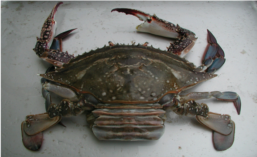
【포란한 꽃게 : 등】