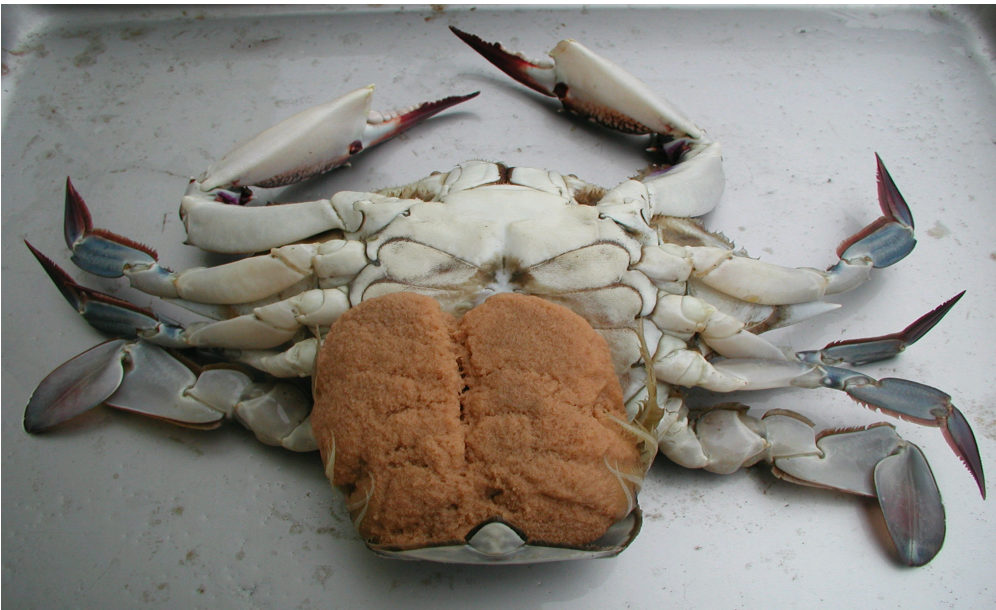
【포란한 꽃게 : 배】