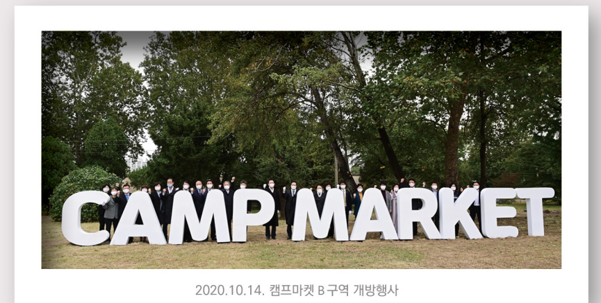
2020.10.14. 캠프마켓 B 구역 개방행사