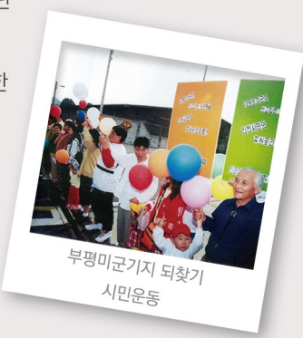
부평미군기지 되찾기 시민운동