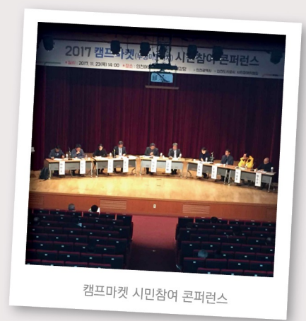
캠프마켓 시민참여 콘퍼런스

이에 따라 캠프마켓 공원조성 등 활용계획에 대한 시민들의 다양한 의견을 듣기 위해, 2017년부터 ‘시민생각찾기’ 프로그램이 진행되고 있으며, 시민들의 명칭 공모로 선정된 ‘캠프마켓 오늘&내일’이 2021년 10월 개소되었다.