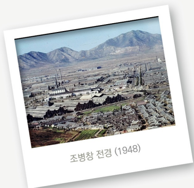
조병창 전경 (1948)