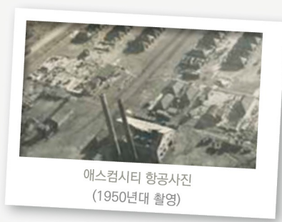
애스컴시티 항공사진 (1950년대 촬영)

기지 안에는 각 부대의 군사시설과 함께 미군들의 생활을 위한 식당, 클럽, PX, 병원, 도서관, 극장, 체육관, 교회 등의 편의시설이 있었다.