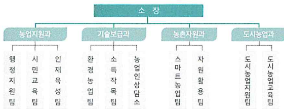
■ 기 구 : 4과 9팀 2농업인상담소