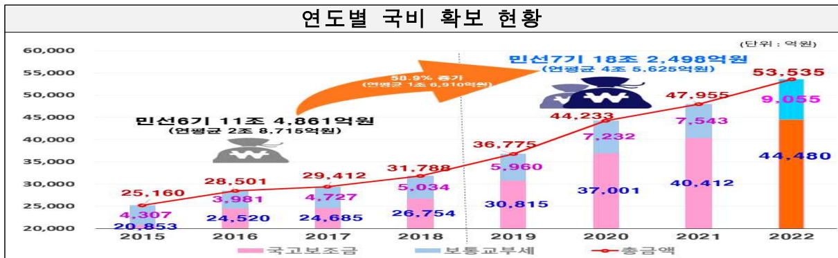
연도별 국비 확보 현황