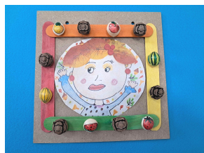
자연물을 이용한 액자 만들기