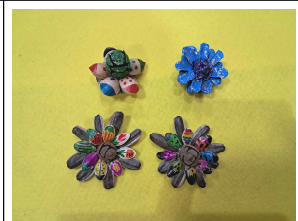
씨앗 브로치 만들기