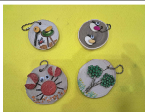
나무 가방고리 만들기