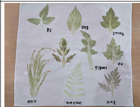
손수건 도감 만들기