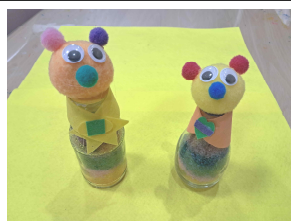
천일염을 이용한 인형 만들기