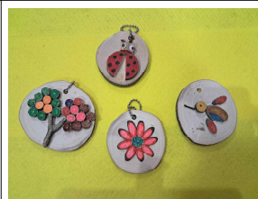
나무 가방고리 만들기