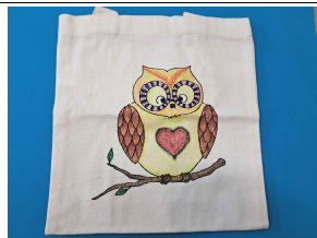
나만의 에코백 만들기