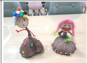
연자방 인형 만들기