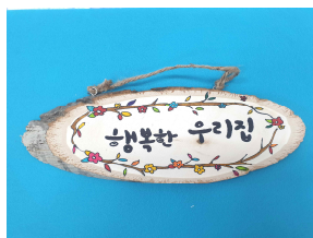
자연물을 이용한 문패 만들기(가족)