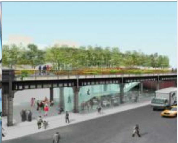
개발 계획 예시안