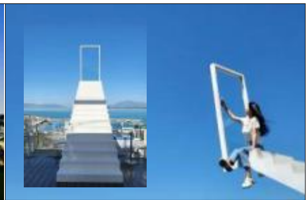
나인뷰 커피 '천국의 계단'