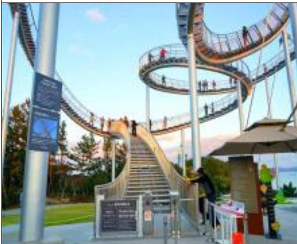
개발 계획 예시안