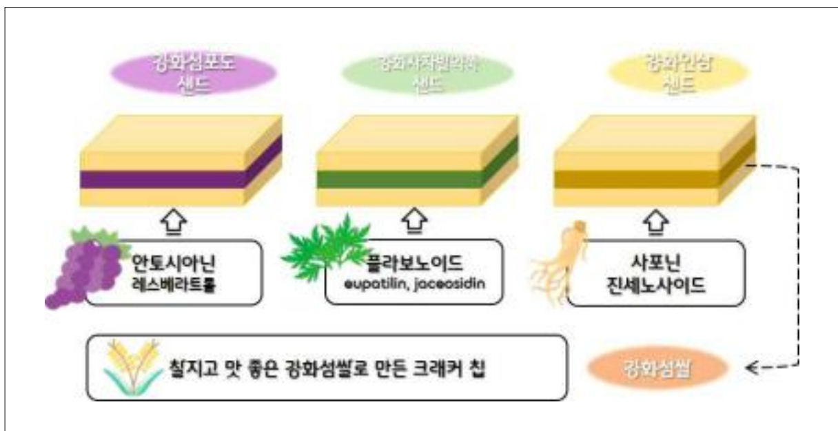
<그림. 인천샌드 개발 도식도>