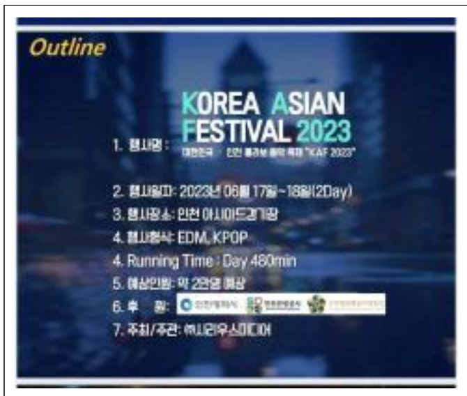
후원명칭 도용 자료(‘23.5.3)