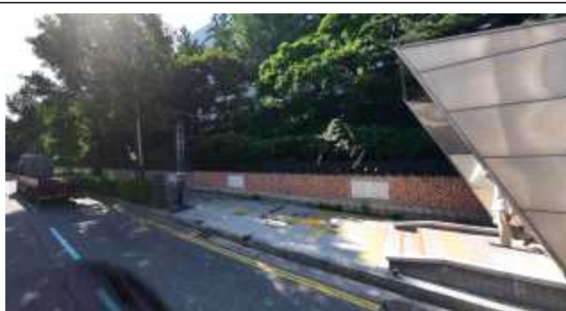
시청역 출구 앞 교육청 담장