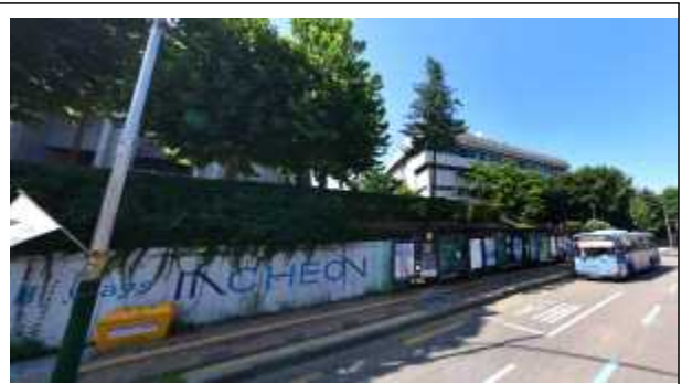
시청 버스정류장 뒤 옹벽