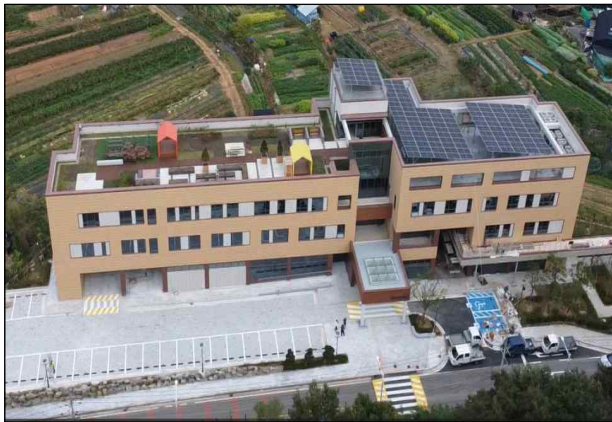
◦ 인천시립요양원 건립공사 준공('23. 9.)