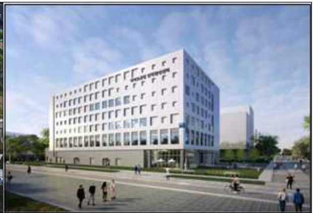
◦ 바이오공정 인력양성센터 구축공사 착공('23. 5.)