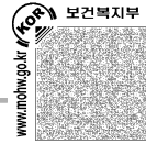
첨부 2. 예산서