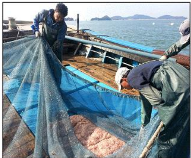
【강화 젓새우 조업(연안자망)】