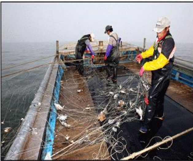
【연평도 꽃게 조업(연안자망)】