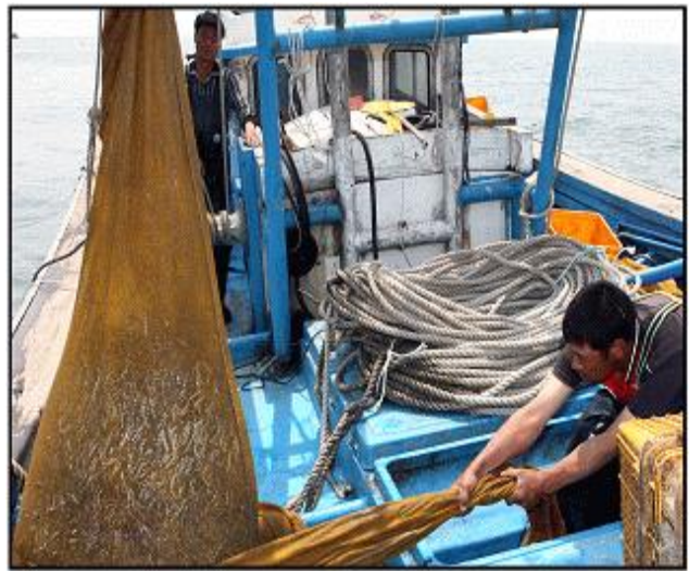
【백령도 까나리 조업(연안개량안강망)】