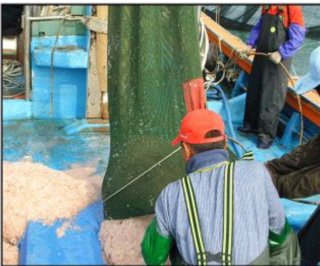
【강화 젓새우 조업(구획안강망)】